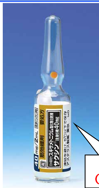
サクシン （筋弛緩剤）