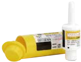
図 バクスマー点鼻粉末剤 ®